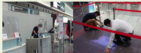
(6月30日北ウイング再開前清掃の様子)

www.jal.co.jp/jp/ja/dom/airport/ticketcounter.html