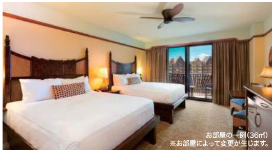
お部屋の一例(36㎡) ※お部屋によって変更が生じます。

ウォルト・ディズニーのクリエイターたちと地元の人々が協力しあって誕生した「アウラニ・ディズニー・リゾート&スパ コオリナ・ハワイ」。ハワイの現代アートやデザイン、多彩なレクリエーション・アクティビティ、エンターテインメントなど…。ハワイの伝統に浸りつつ、その本当の魅力を実感いただけるリゾートです。