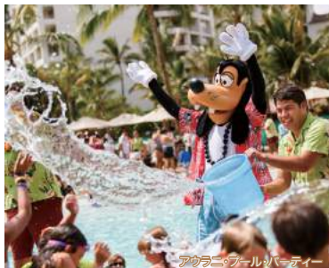
アウラニ・フルバーパーティー

※ダブルベッド2台またはキングベッド1台のお部屋となります。エキストラベッドはご利用いただけませんが、添い寝も含めて1室最大4名様まで利用可能です。