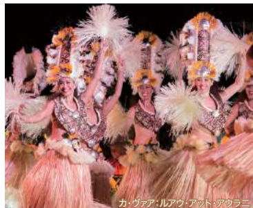
カ・ウァ・ア・ル・ア・アット・アウラニ