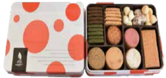
クッキーの詰合せ (12種)