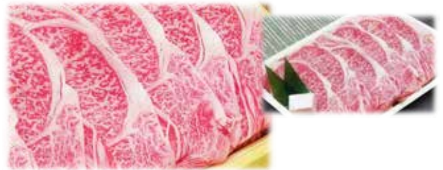
近江牛 A 5 クラシタ (肩ロース) 4 0 0 g