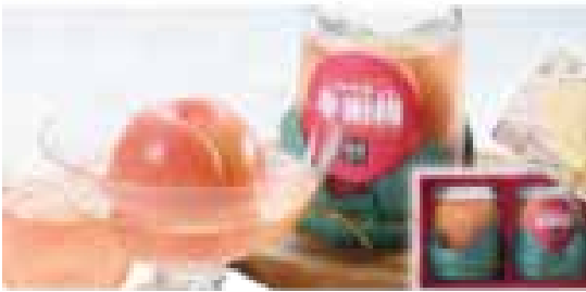
桃の瓶詰 × 2 個

旬が短い桃を種付き・皮付きで丸ごと長期保存。生に近いとろけるような食感を年中味わえます。