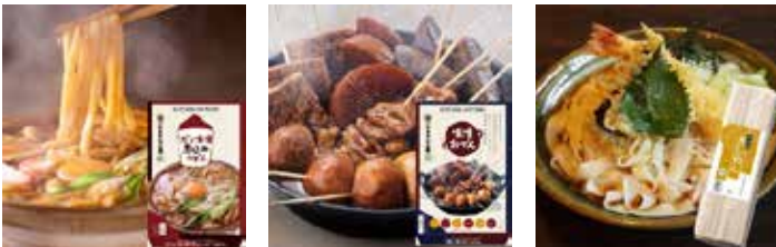
だし味噌煮込みうどん 2 人前 × 3 個セット／味噌おでんセット 3 人前／ 長者町きしめん 1 8 0 g × 2 人前