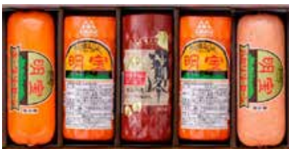
明宝ハム 2 本／瑞峰ソーセージ 1 本／ポークソーセージ 1 本／パセリソーセージ 1 本

幻のハムと言われた人気 No.1 のロングセラー商品とバラエティ豊かなソーセージの詰め合わせ。