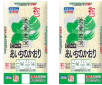
愛知県産あいちのかおり 5 k g × 2