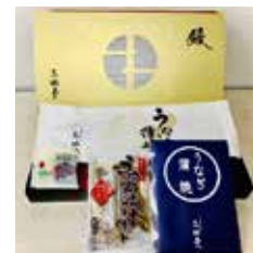
冷凍蒲焼 (タレ・山椒付) × 1 / レトルト蒲焼 × 1 / うなぎ茶漬 × 1