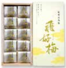
紀州 大粒梅 × 10粒

紀州産の特に大粒の梅「飛梅」を使用した、旨味と やわらかい口当たりが特徴の甘口梅干です。